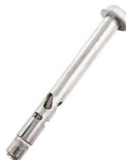
六角螺杆套管锚栓