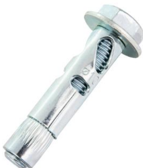
六角螺杆套管锚栓